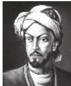
سید عمادالدین نسیمی

بهار آمد بهار آمد بهار سبزپوش آمد رها کن فکر خام ای دل که می در خم به جوش آمد لب ساقی و جام مل، میان باغ و فصل گل غنیمت دان که از غنیم سحرگاه این به گوش آمد که: صوفی گم می صافی نمی نوشد مکن عیش حیات تازه را محرم فقیه دزدنوش آمد دلا در یوزه همت ز باب می فروشان کن که بوی نفعه عیسی ز پیر می فروش آمد می گلگون خور ای زاهد که از قدس الوهیت گل آورد آتش موسی و بلبل در خروش آمد مرا بی عشق مهرویان بقای سر نمی باید که سر بی عشق در گردن کشیدن بار دوش آمد مکن آه ای دل پرغم، بیوش اسرار دل محکم که نامحرم خطابین است و می باید خموش آمد در آبدیده دوش از غم، مپرس ای دل که چون بودم که از غم سر به سر طوفان مرا تنها نه دوش آمد به بانگ چنگ و عود و نی بنوش ای رند عارف می که طاب العیش و طوبی لک ز فضل حق سروش آمد به صوفی می ده ای ساقی که در دارالشفای ما علاج علت خامی شراب پخته جوش آمد نسیمی تا نلب جانان و جام می بود دیگر به زهد خشک بی حاصل نخواهد سرفروش آمد