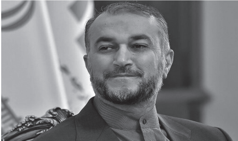
امریکا آغاز کرده‌اند. وزیر خارجه آمریکا از سرزمین‌های منفذ آتش‌بس و آغاز دوباره تجاوز نظامی رژیم صهیونیستی علیه غزه دقایقی قبل از خروج

صهیونیستی هستند. خون‌آشامان صهیونیست پس از کشتار بیش از ۱۵ هزار فلسطینی، دور جدید کشتار خود را در سایه ادامه حمایت دولت آمریکا آغاز کرده‌اند. ملت‌ها و اکثریت قریب به اتفاق دولت‌های جهان، تداوم آتش‌بس و توقف کامل حملات رژیم صهیونیستی علیه غزه و کرانه غربی فلسطین را فریاد می‌زنند ولی صهیونیست‌های جنایتکار و کودک‌کش در خیال پوچ جبران شکست ترمیم ناپذیر، با کشتار غیرنظامیان، کودکان و زنان بدنبال پیروزی هستند. بدیهی است مسئولیت سیاسی و حقوقی تداوم تجاوز و استمرار کشتار سبعانه مردم فلسطین، علاوه بر جنایتکاران رژیم صهیونیستی، بر عهده دولت آمریکا و چند دولت معدود حامی این رژیم آوارتاید است.