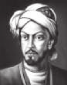
سید عمادالدین نسیمی

تا هوای طوبی قد تو دارد جان ما هست منزل آیت «طوبی لهم» در شأن ما قبله و ایمان عاشق نیست الا روی دوست تا که هست و بود و باشد قبله و ایمان ما در ازل چون با تو پیمان محبت بسته‌ایم هست چون حسن تو باقی تا ابد پیمان ما بر سر زلف تو خواهد رفت باز این دین و دل این دل آشفته حال و جان سرگردان ما اشک سرخ آمد گواه و زردی رخ شد دلیل حال ما می‌کن قیاس از حجت و برهان ما خواب از آترو خوش نمی‌آید به چشم ما که هست خلیل سلطان خیالت روز و شب مهمان ما وصل رویت گر شبی مهمان ما گردد ز لطف جنت و فردوس گردد کلبه احزان ما حال درد خاص ما را با طیب ای دل مگو کنز طیب عم نامش توان یافتن درمان ما خسرو انجم به جای خود بود گر بنده‌وار بر میان بندد کمر پیش رخ سلطان ما با نسیمی بوی زلفش می‌زند هر دم خطاب کای نسیم روح‌پرور زان مایی زان ما