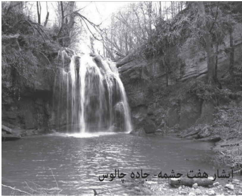
آبشار هفت چشمه- جاده چالوس